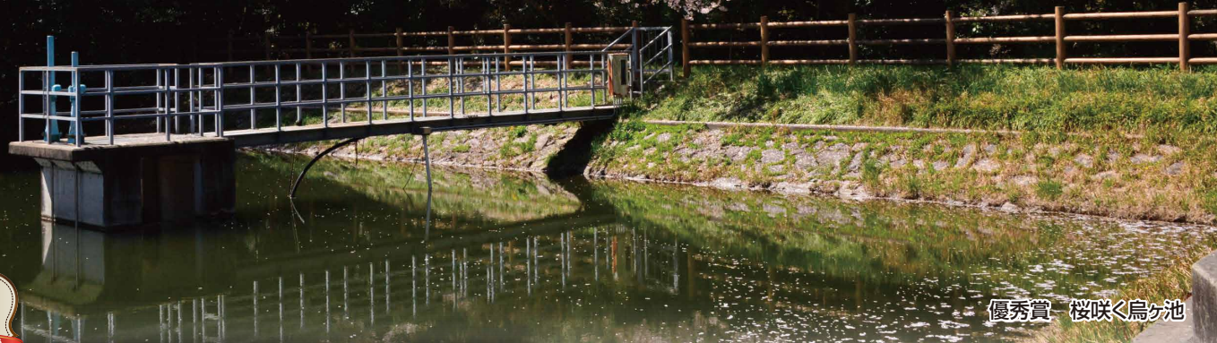
優秀賞 桜咲く鳥ヶ池