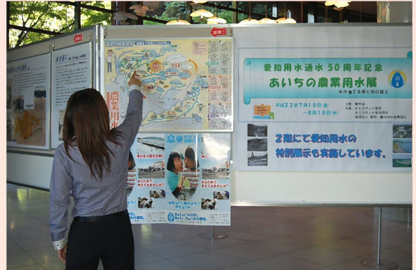
あいちの農業用水パネル展

1階のロビーには「水を拓く」「水を導く」「水を育む」のテーマ順にあいちの農業用水（愛知用水、木津用水、宮田用水、木曾川用水、明治用水、枝下用水、矢作川用水、豊川用水など）を紹介したパネルを展示した。